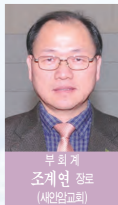
부회계 조계연 정로 (새인일교회)